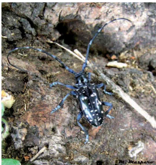
FOTO1: adulto alla base di un albero.

Dalle incisioni di ovideposizione è possibile osservare la fuoriuscita di segatura, prodotta dalle larve neonate, che a lungo andare si accumula a formare