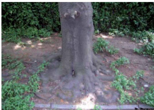
FOT08: fori di uscita alla base di un faggio.

Si invita perciò chiunque noti sintomi sospetti di avvisare tempestivamente l'Unità Periferica per i Servizi Fitosanitari.