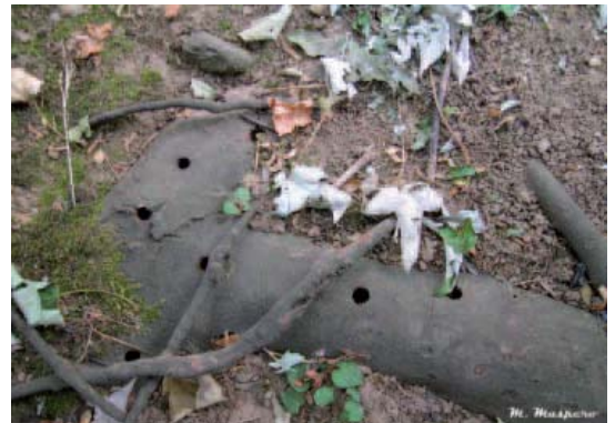
FOT09: fori di uscita su radice superficiale di Acer .