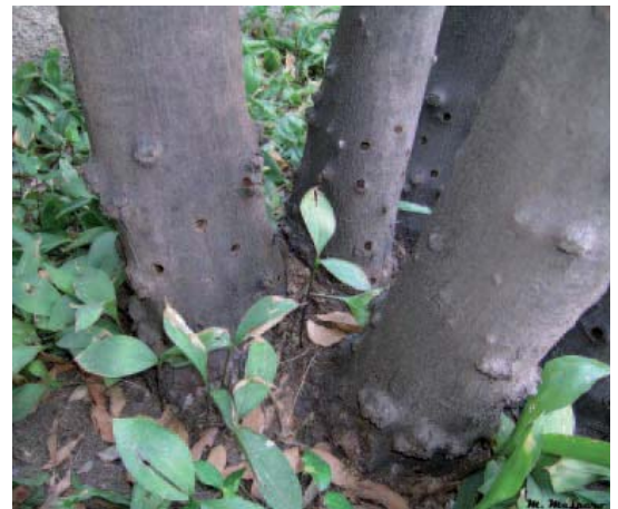
FOT10: fori di uscita su Acer saccharinum .