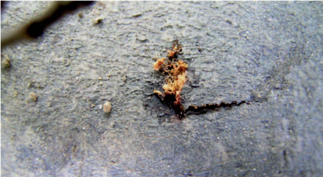
FOTO4: incisione di ovideposizione.

caratteristici cumuli dal colore rossastro (foto 7). L'impupamento avviene in prossimità della corteccia, a partire dal mese di aprile.