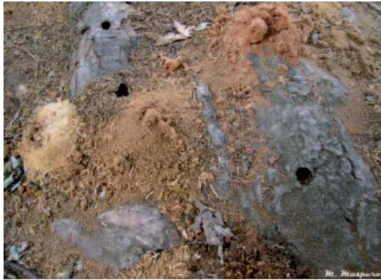
FOT07: segatura e fori.