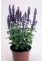
Salvia x superba 'Adora blu'