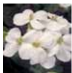
Arabis caucasica 'Snowfix'