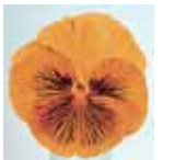
Viola wittrockiana 'Cats' Orange'