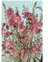
Sidalcea hybrida 'Partygirl'