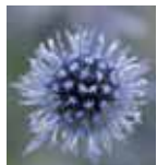
Eryngium planum 'Blue Glitter'