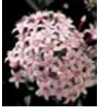
Pentas lanceolata 'Kaleidoscope Apple Blossom'