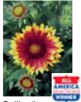
Gaillardia aristata 'Arizona Sun'

Sul Sito: www.navigatorevarietale.it in mostra le foto e le descrizioni di tutte queste varietà.