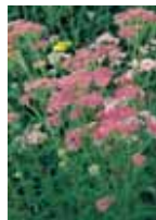
Achillea millefolium 'Cerise Queen'