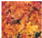
Heuchera hybride 'Amber Waves'