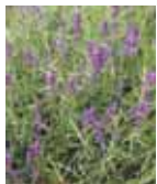
Lavandula angustifolia 'Dark Hodcote Blue'