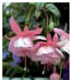
Fuchsia 'Pink Galore'