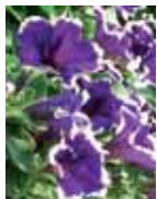
Petunia 'Sunpleasure Happy Evita Blue White'

Argyranthemum frutescens 'Honey Star' - Appartiene al gruppo 'Summer Lover' un logo che garantisce varietà eccezionali per l'utilizzo in aiuola e balcone. La varietà 'Honey Star' ha crescita compatta ma necessita di qualche trattamento di nanizzante. La fioritura si presenta con fiori di medio grandi dimensioni bianco puro con centro giallo. E' adatta per impianti molto intensivi e si consiglia per colture a temperature basse.