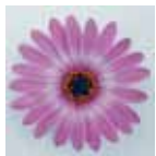
Osteospermum 'Impassion Pink Blush'