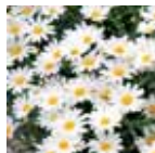
Argyranthemum frutescens 'Honey Star'