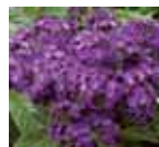
Heliotropium arborescens Scentropia® Dark Blue