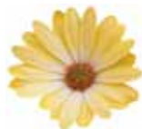
Osteospermum ecklonis Tradewinds® 'Yellow White'