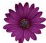
Osteospermum ecklonis Tradewinds® 'Deep Purple'