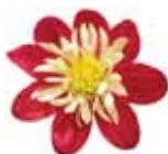
Dahlia x hybrida Goldalia 'Scarlet'