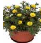
Asteriscus maritimus 'Aurelia Gold'