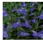
Lobelia erinus Laguna® Trailing Dark Blue