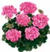
Pelargonium zonale Tango® 'Neon Purple'