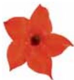
Mandevilla hybrida Rio® Deep Red