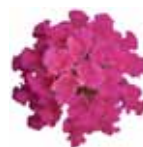
Lantana camara Bandana® 'Cherry'