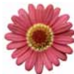
Argyranthemum frutescens 'Molimba' XL Watermelon