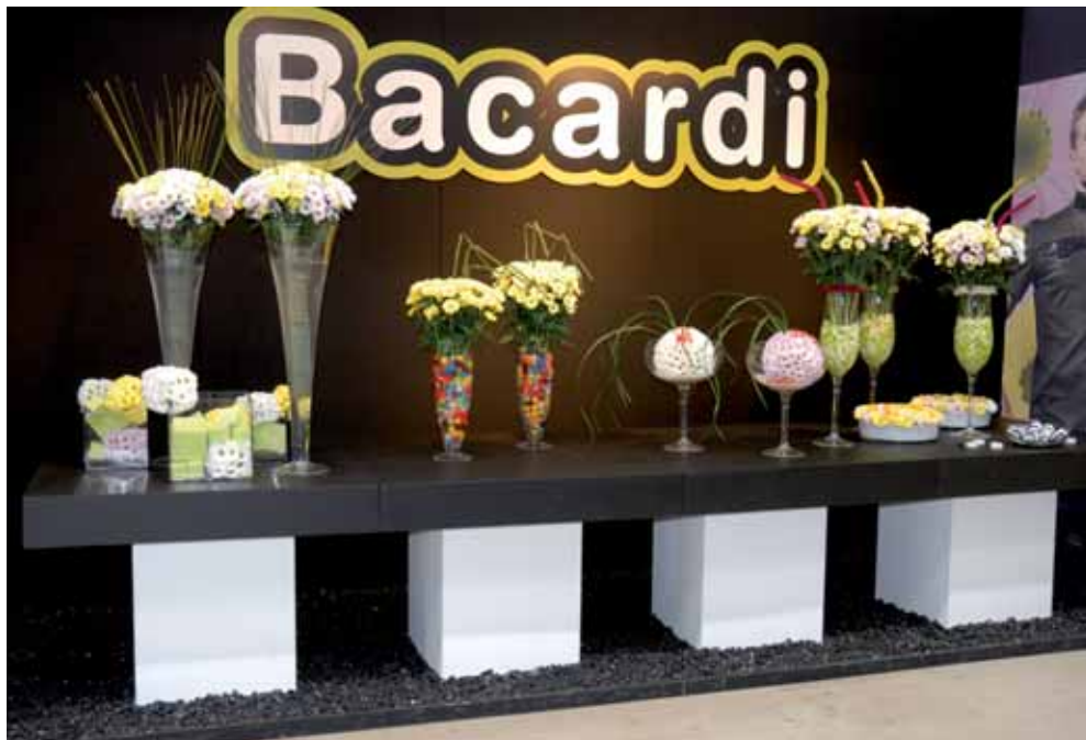
La Serie Bacardi è stata ampliata con la nuova varietà Bacardi 'Sunny'

mercato, che condividono la nostra filosofia di puntare sui "brands" di prodotto e sono in grado di trasmettere le nostre idee e competenze al mercato italiano.