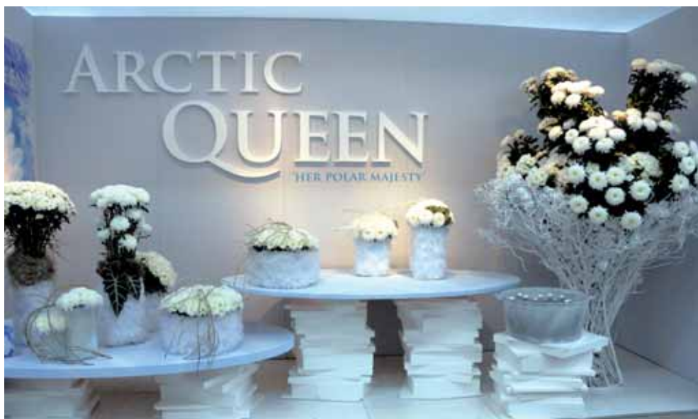
A destra la suggestiva presentazione di 'Arctic Queen' sua maestà polare