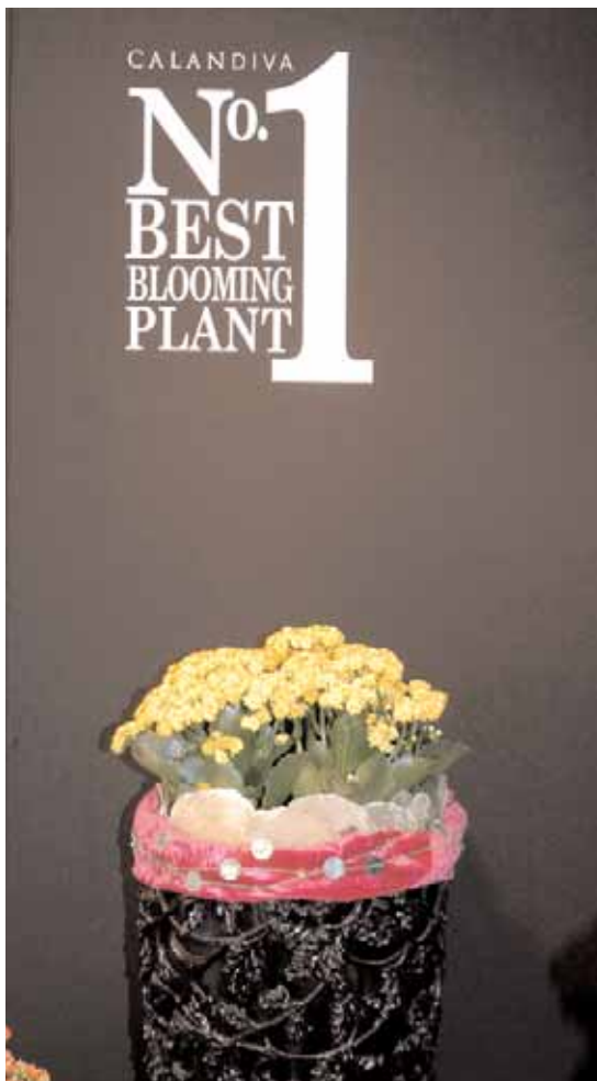
Calandiva, la pianta fiorita numero uno

Una volta Fides era conosciuta esclusivamente come produttrice di crisantemi con una produzione attorno al miliardo di talee e ora?