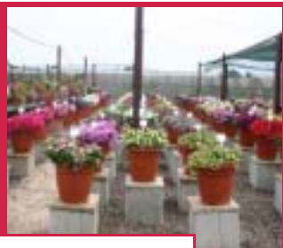
Clienti in visita - giugno 2005